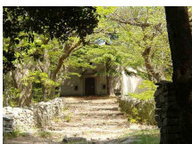
Convento salesiano di San Cerbone a Lucca