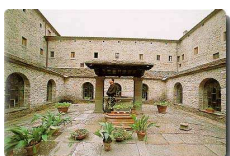
Abbazia francescana di La Verna ad Arezzo