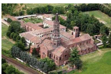
Abbazia cistercense di Chiaravalle a Milano

http://www.stigmatinisezano.blogspot.com/