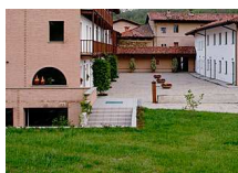
Comunità monastica di Bose a Magnano (BI)

http://www.borgodichiaravalle.it/l-abbazia.html