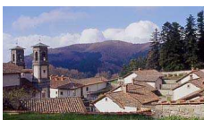
Eremo benedettino di Camaldoli ad Arezzo