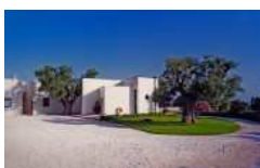
Comunità monastica di Bose a Ostuni (BR)

http://www.officine.it/montecassino/main_i.htm