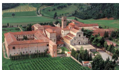
Abbazia benedettina di Praglia (PD)

http://www.isola-sanfrancescodeldeserto.it/